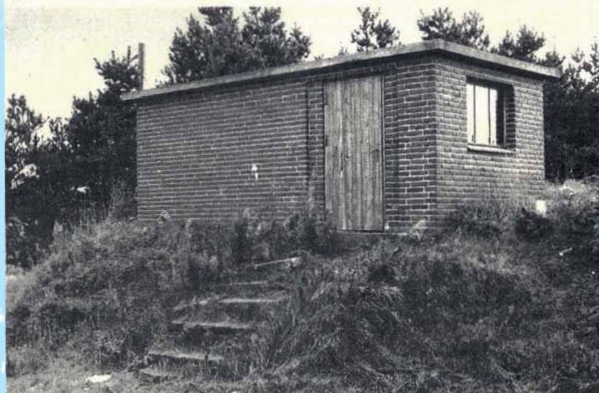
Den gamle vandtryksforøger i Henneby står for fald. Sprængningsekspertes fra det lokale hjemmeværnskompagni står for det praktiske arbejde omkring bortsprængningen, der foregår på lørdag.

dekommet, og sprængningen er fastsat til lørdag, den 4. oktober. Klargøringen påbegyndes kl. 9.00 og selve sprængningen forventes at ske omkring kl. 11.00. Interesserede, der ønsker at overvære sprængningen, er velkomne. Sikkerhedsanvisningerne skal følges.