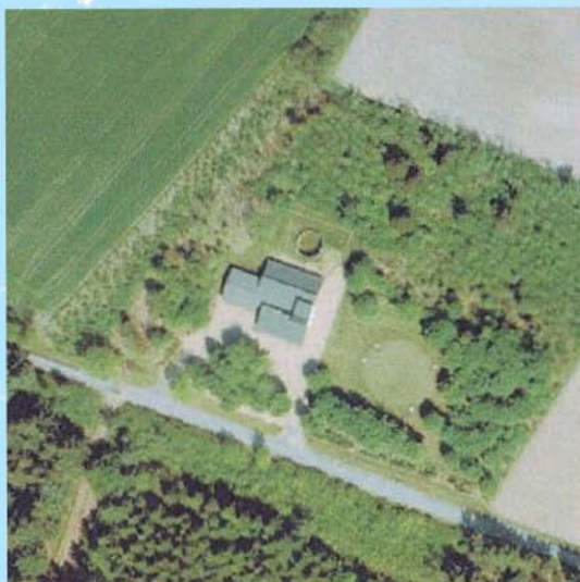
Luftfoto: Skovvej 10 År 2012