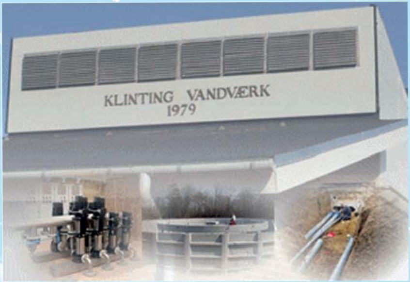
Klinting Vandværk 2003