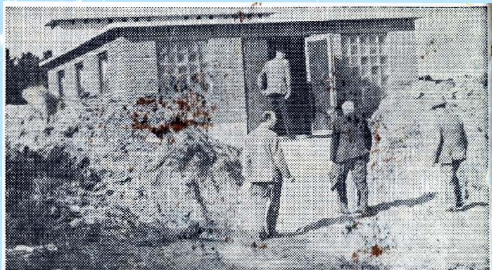
Det store moderne vandværk ved Houstrup blev besigtiget af kommissionens medlemmer.

Bestyrelsen for Klinting Vandværk har besluttet at udgive denne folder i anledning af vandværkets 50 års jubilæum, som afholdes den 28. marts 2013.