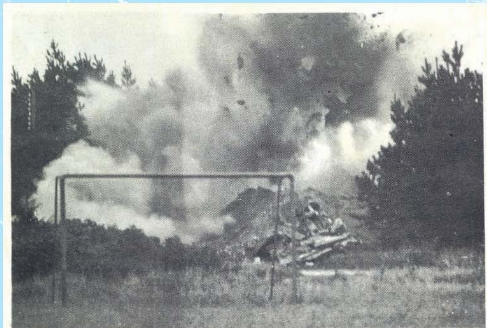
Det gik ikke stille af, da sprængeksperter fra hjemmeværnskompani 3102 Blåbjerg, antændte de 16 kg trotyl, der var sænket ned i vandbeholderen under den gamle vandtryksfører i Henneby.