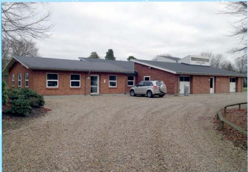
Klinting Vandværk 2013