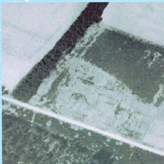
Luftfoto: Skovvej 10 År 1955