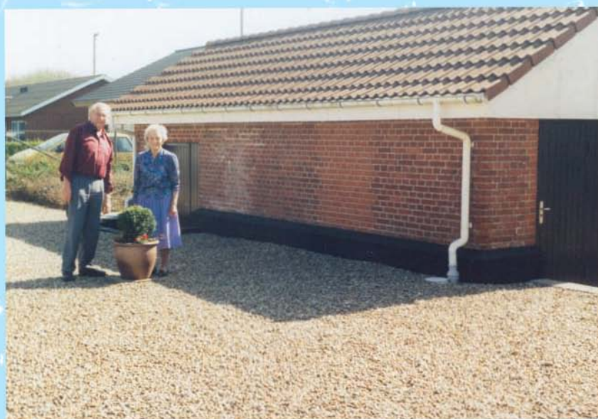
Henne Vandværk 1933 - 2012