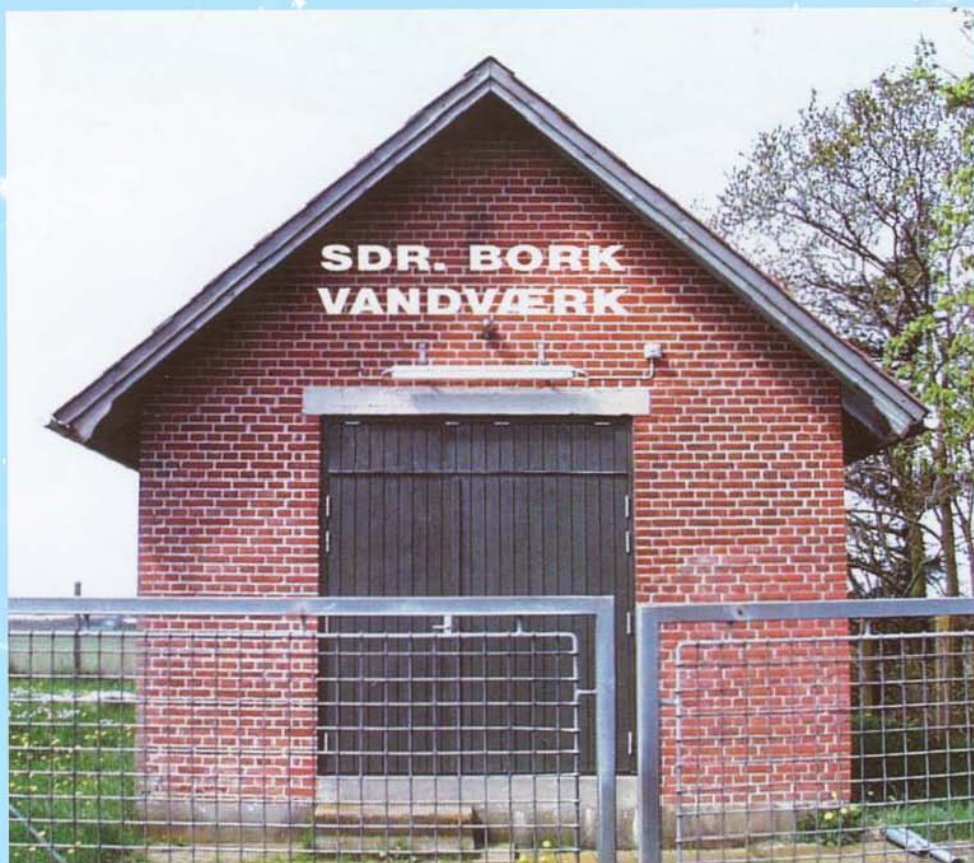
Bork Vandværk 1943 - 2011