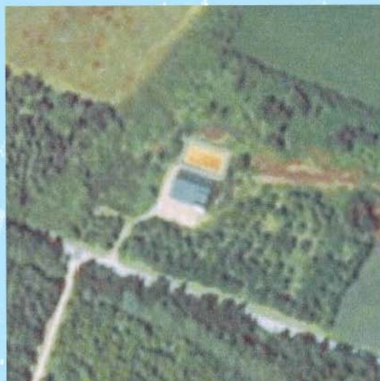
Luftfoto: Skovvej 10 År 1995