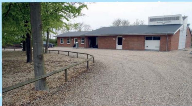
Skovvej 10 År 2012